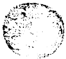
صورة الصفحة الأخيرة من الجزء الثاني من مخطوطة دار الكتب المصرية