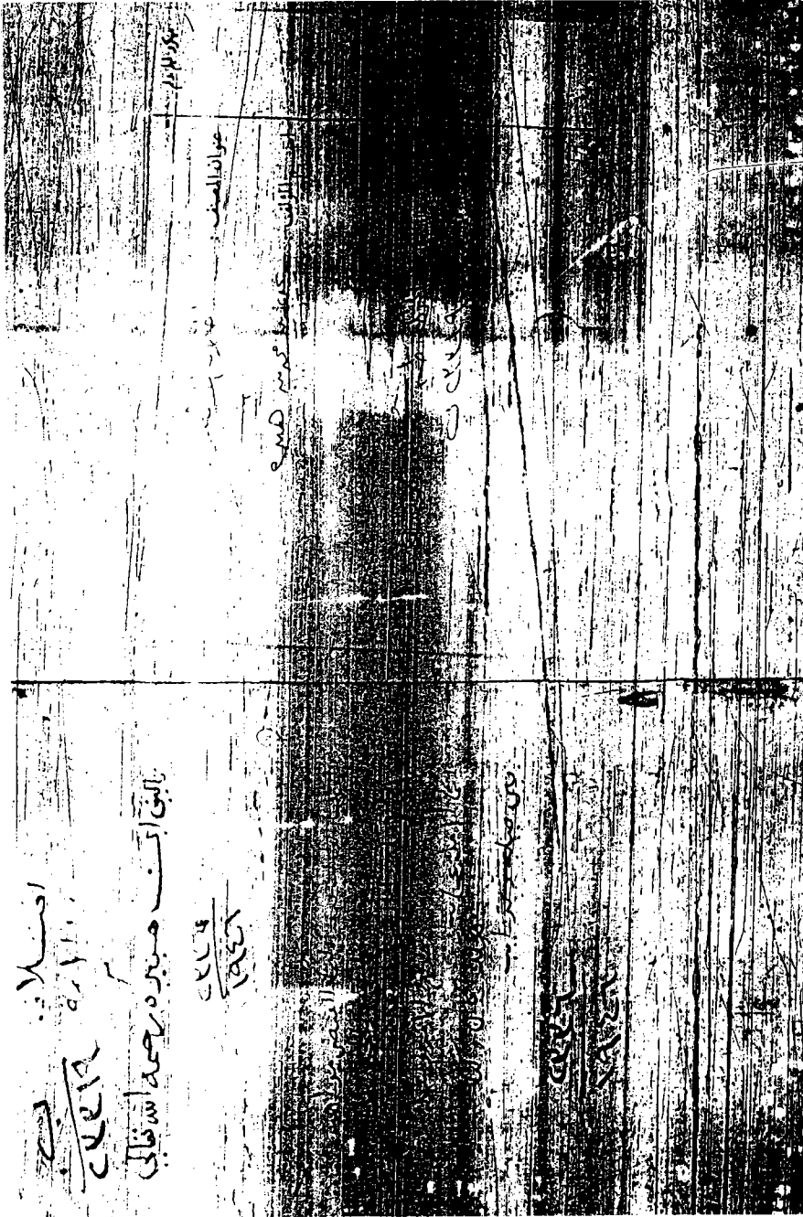
صورة أول المخطوطة الأولى