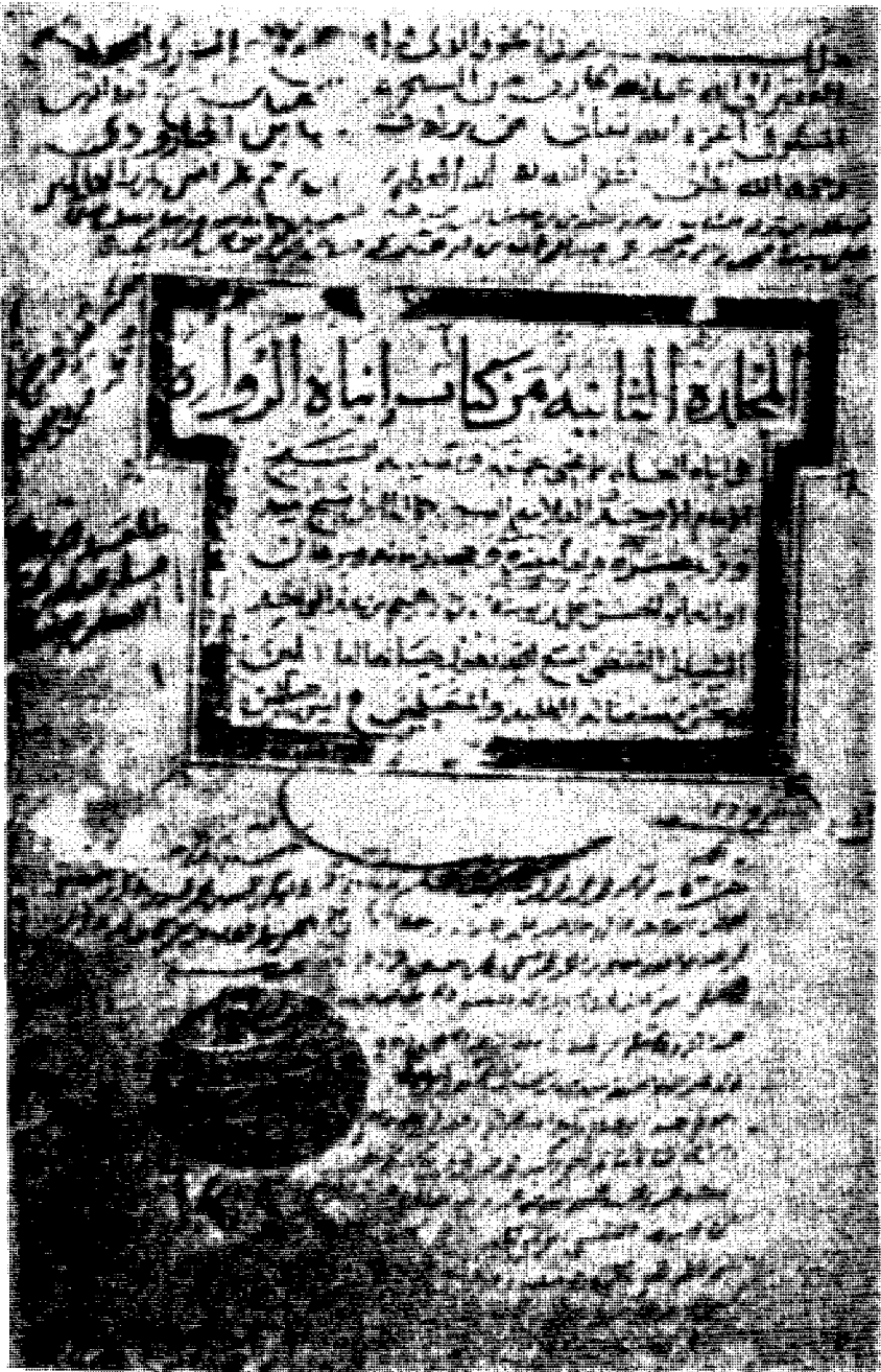
غلاف المجلد الأول من نسخة فيض الله