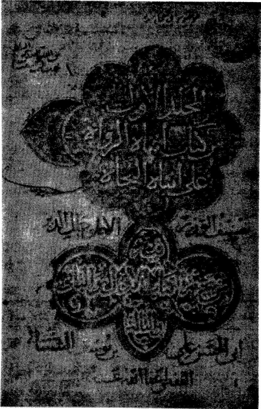
غلاف المجلد الأول من نسخة طبرقو