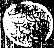
الورقة الأولى من النسخة التركية وهي التي أشير إليها بحرف - ت - .