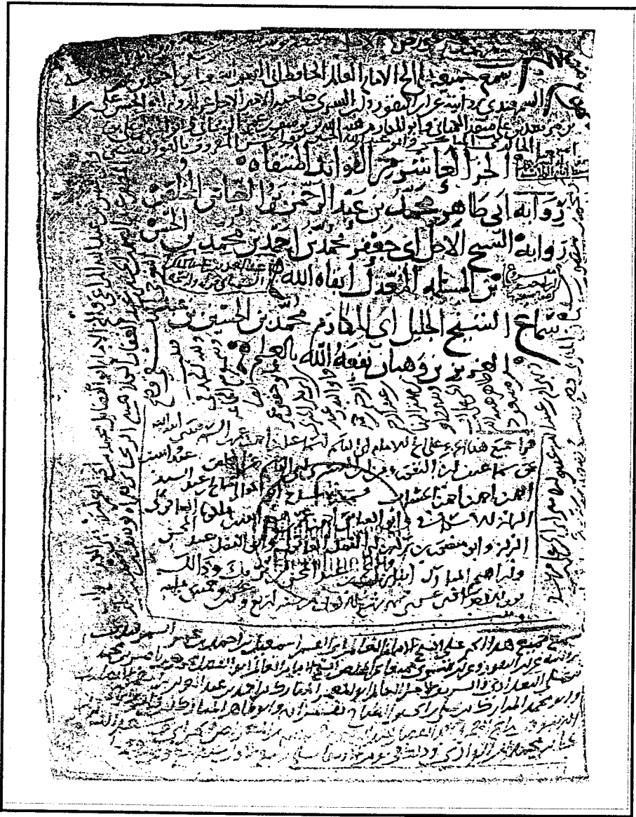
ورقة العنوان من الأصل (بر)