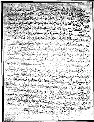
الورقة الأخيرة من مختصر كتاب أبي شامة