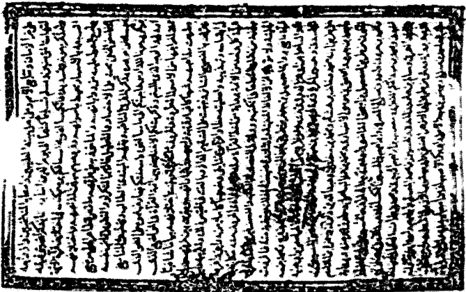
[صورة اللوحة الأولى من النسخة م]