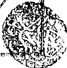
[صورة اللوحة الأخيرة من النسخة م]

بحرفين كثيرا واخر السور بالتكبير وهو كسر ما كان آخر من ساكنا او مخرجا قد خففت التثنية في ما ليس فيه او خففته او رفعه لسكون ذلك وسكون اللام من اسم الله تعالى فالساكن مخوفونه فحدث الله اكبر ومن مسدده كبر وما تشبهه وان تحركت اخر السور بانفج او الخفض او الرفع ولم يلحق هذه الحركات الثلاث ثنوين ففتح المفتوحين ذلك وكسرا لكسور وضمة لضموم لا غير فالمفتوح ثنوين كالكسور الله اكبر واذا حسد الله اكبر وما تشبهه وانكسور مخوفونه عن النعم الله اكبر ومن بحذو والناس الله اكبر وما تشبهه والفتوح مخوفونه هو الا بتزائه اكبر وما تشبهه وان كان اخر السور هاء ضمير موهولة بو او وا في اللفظ حذف مسلمات الساكنين سكونها وسكون اللام بعدها مخوفونه من خشية ربه الله اكبر وتزايروا الله اكبر والفتوح والفتوح في اسم الله تعالى ساكنة في جميع ذلك في حان الرفع استغنا عنها بما افضل من اخر السور بالساكن الذي يجنب لاجله واللام مع الكسرة مرفقة ومع الفتحة والضممة مفتحة فاعلم ذلك في عمل ما سمعته ووقف معانا مويذا ان شاء الله تعالى وبالله التوفيق وهو حسبا ونعم الوكيل وبسلي الله على سيدنا محمد وعلى آله الطيبين الطيبين قد وقع لفرج من يوم الرعب او نصف الليل سنة ست وأربعين لمائة والفتوح سوده الفقير اضعفا العياك ابو بكر البولوك الساكن بمدرسة محمود باشا غفر الله له ووالديه في شهر ربيع الثاني سنة ١٢٠٠