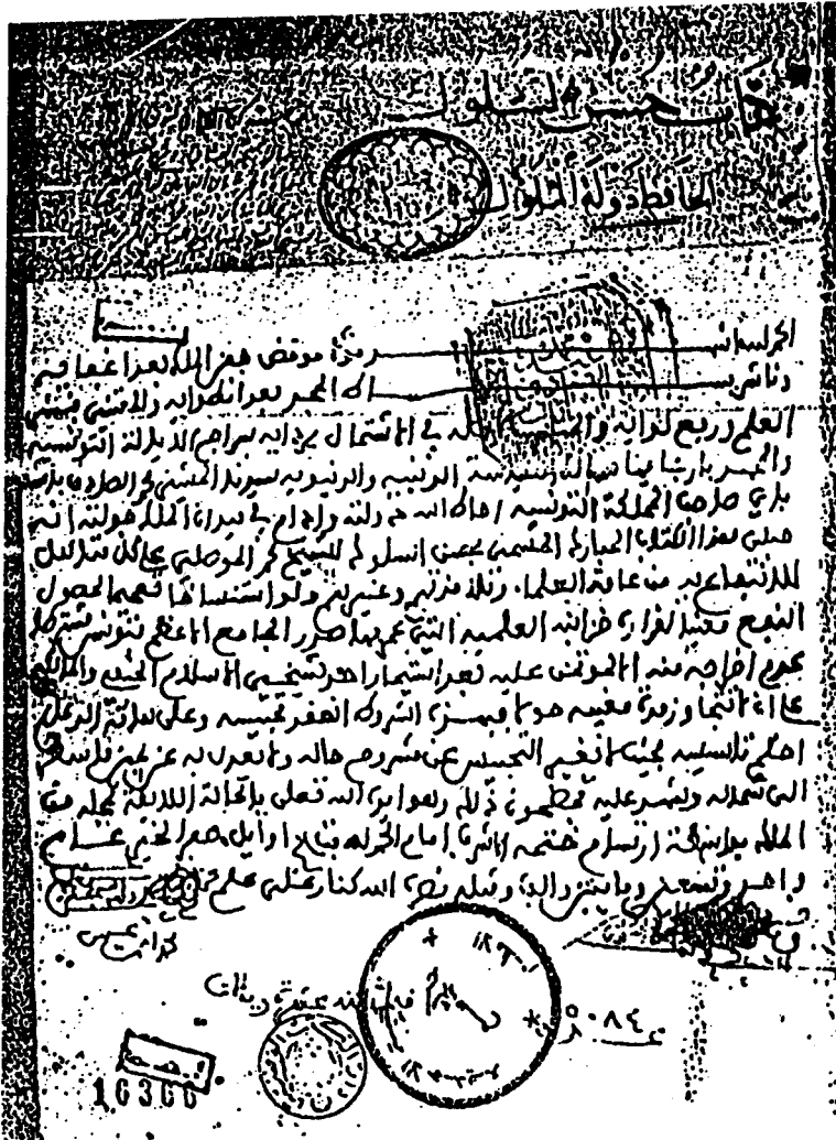
عنوان الكتاب في النسخة التونسية