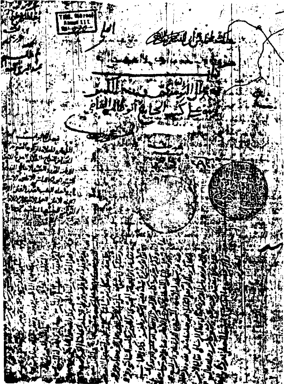
صورة الورقة الأولى من النسخة الخطية