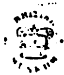
الصورة رقم (٦)

اخبر الخاتم والمهذب العلي بن صلوة بن ابي بكر بن محمد بن