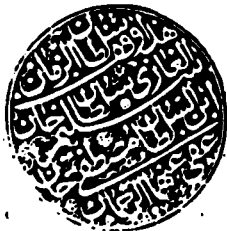
الصورة رقم (٣)

بِأَسْمَاءِ بَيْعَتِ وَيُتَقَبَّلُ أما الأدلة ما بين وعين مضمومة وتأخذه صقع بيان في الحديثان النبي صلى الله عليه وسلم كتب لا تزال شجرة لسر الله من محمد رسول الله إلى المهاجرين والأنبياء ما أصبح ما كان لم فيما من مكة وعمران وما هدموا ما كان من حججهم وما كان لهم من مال الله ما بيعت الأنبياء وما كان لهم من مال يخضرونه وأما الثاني فأوله يأخذ تأخذ ما كانه وقاب مفتوحه وبأسماء جلاله ما قرآنه وخلافه ما بين لعنهم نَجَزَ الْكِتَابَ وَالْحَمْدُ لِلَّهِ رَبِّ الْعَالَمِينَ وصلى الله على سيدنا آدم محمد وآله الطيبين الطاهرين وعلى صحابته أجمعين وفرغ من نسخه العبد الفقير إلى ربه القدير أبو بكر بن محمد بن عباس الحنفي في رابع عشر جمادى الآخرة من سنة عشرين وست مئة وهو يحمد الله تعالى ويصلي على محمد وآله وصحبه ويسأله التوفيق