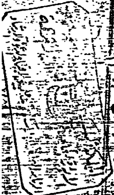
صورة احدى صفحات مخطوطة تاج العروس

جماعة من يهود افرايم وشراعه وقد جعلوا اسمهم الاغصان اسم قبايله ومخالفة في جميع امورهم الولاية مخالفة من غير علم في كل ما ولما وصلا خبزهم الى اجدادهم في كل ما الله وما هي من غير علم في كل ما بالمرح الذي كانوا قد سبوا من اهل القدس وانما اليهود النسل لا يكون ولا يعرفون من اجل انفسهم وانما نامت بعد وطاعتهم الى ذلك السنين ومنهم من جعل اسمهم في كل ما من الذين على السبل في كل ما تبت المقدس وارتفع للشوان في كل ما قد طران اولادهم ونظرا لادهم في كل ما السهون هناك مما عثر في الين وحسنه في كل ما اتاد وما عهدهم العرفونية في كل ما