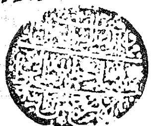
صورة الصفحة الأخيرة من النسخة آ

هذا الكتاب من كتب الفقه الحنبلية في بيان ما كان عليه الفقهاء من الحنابلة في بيان ما كان عليه من الفقه الحنبلية في بيان ما كان عليه من الفقه الحنبلية