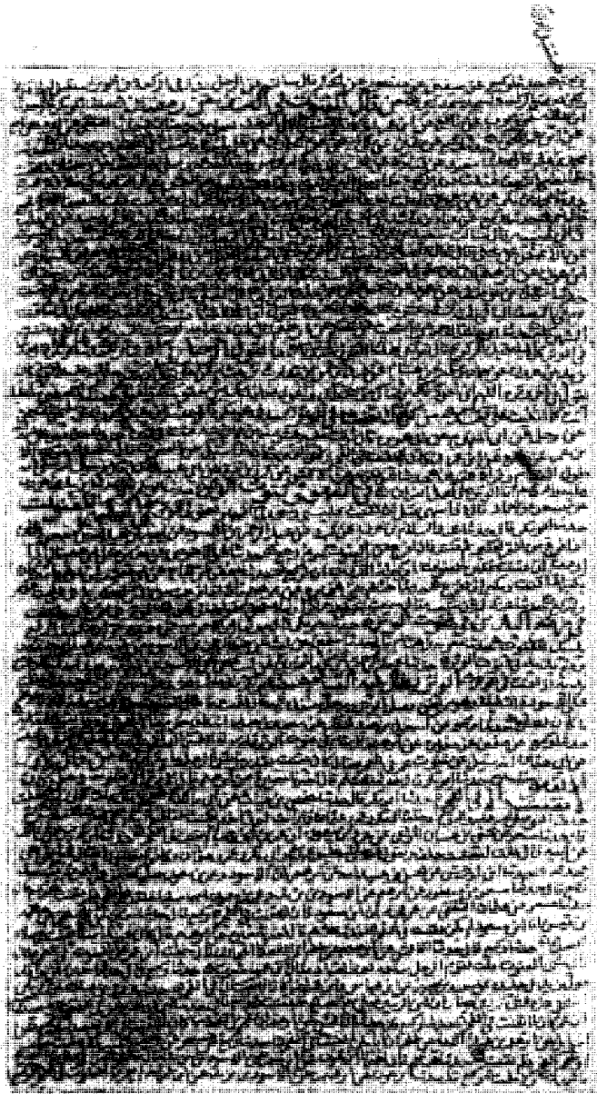
الصفحة الأخيرة من القسم المعتمد في هذا المجلد من نسخة (ع)