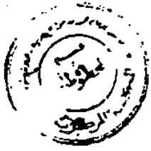
صورة الصفحة الأخيرة من المخطوط