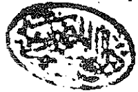
لوحة العنوان من نسخة دار الكتب المصرية

بقره الله في حقه ورضوانه رواية ابو علي الحسين بن صفوان بن اسحق بن ابراهيم البرقي عنه رواية النبي صلى الله عليه وسلم اخبرنا عنده بالمندرج عنه رواية ابي عبد الله الحسين بن احمد بن محمد بن يحيى بن محمد بن الحسين بن علي بن رواية الاشباح ابو الفضل محمد بن اسحق بن علي بن ابي البركات بن المبارك بن نصر السراج وابو منصور هو وبن عبد الواه من محمد بن الحنفين والكاتبه محو الفاشده من بن ابي الفراء بن السنوح الياوي عنه روايه ابي الحسن بن ابي عبد الله بن المعتز البغدادى كخالي عنهم الكافور ابن الحسن الدنيا حرمه ما رواه عنه الشيخ الامام لم يركن الحسن بن احمد بن شهرزورى روى الله بن حمزة بن عبد الحسن بن