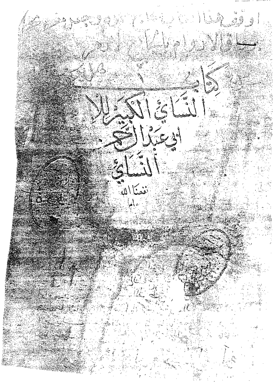
الورقة الأولى من النسخة (ز)