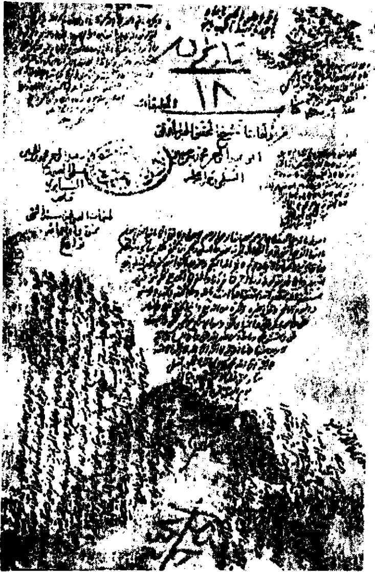
صورة خلاف المخطوط